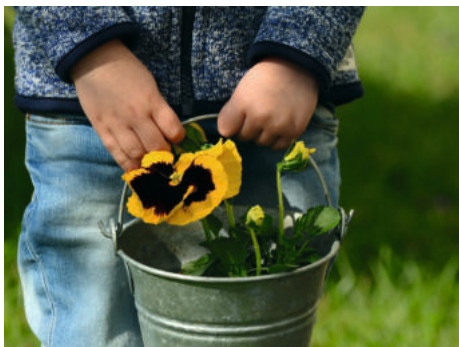
Beispiel - Bild zeigt nur die Hände